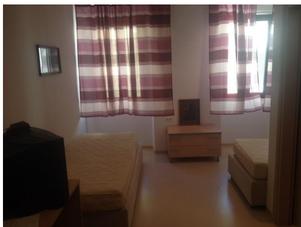
Smještaj za osoblje