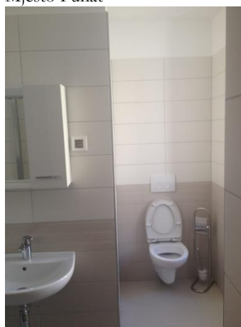
Smještaj za osoblje